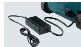
Cable (a través del adaptador de CA)