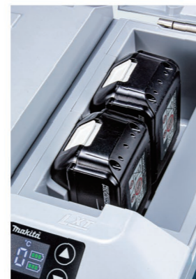
Batería LXT de 18V (dos en paralelo o una)