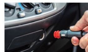
12V/24V DC (enchufe para cigarrillos)