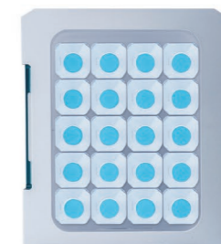
20 Botellas de plástico de 500mL